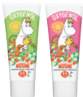
Oxygenol Muumi 50 ml 3-5 vuotiaalle, maku mansikka