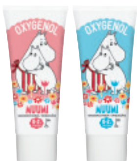
Oxygenol Muumi 50 ml 0-2 vuotiaalle, maku mansikka