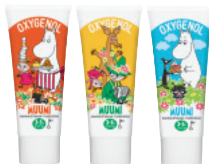
Oxygenol Muumi 50 ml 3-5 vuotiaalle, maku tuttifrutti